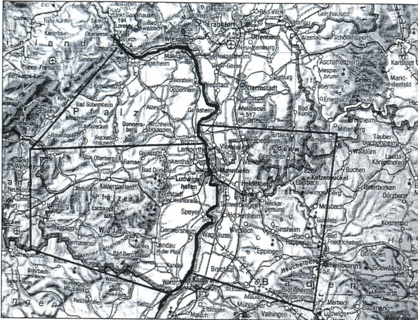
Bildo 1: Proksimuma etendiĝo de la (iama) Palatinato

La plej fama antaŭhistoria trovitaĵo de la regiono estas prahoma makzelo, elfosita proksime de la iama palatinata reg-urbo Heidelberg kaj tiel nomata Homo heidelbergensis (Homo hejdelberga).