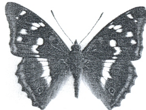
Bildo 1: La “granda ŝanĝbril-papilio” Apatura iris , papilio de la jaro 2011, en la natura grandeco.

La granda kaj belega arbara papilio Apatura iris okulfrapas pro sia violablua ŝanĝiganta brilo sur la faco de la nigrabrunaj flugiloj de la masklo. La tipa ŝanĝobrilado, kiu mankas al la femalo, estas kaŭzata de etaj aerveziketoj en la flug-