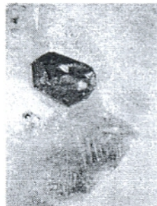
Bildo 2: Kiom aĝa diamanto estas, tion oni nur scias pro la dateno de ties maloftaj grenat-inkludaĵoj

Lumon en tiun ĉi sciadan mallumon nun alportis la geofemiisto S.H. Richardson kaj kunlaborantoj, kiam ili ekzamenis sudafrikajn diamantojn kun grenat-inkludaĵoj. La kristalografiaj ecoj de la grenatoj permesas la konkludon, ke ili ekestis kune kun la diamantoj. La rezultoj eklipsis ĉiujn ĝis nun faritajn konjektojn: la diamantoj estas aĝaj 3,2 ĝis 3,4 miliardojn da jaroj.