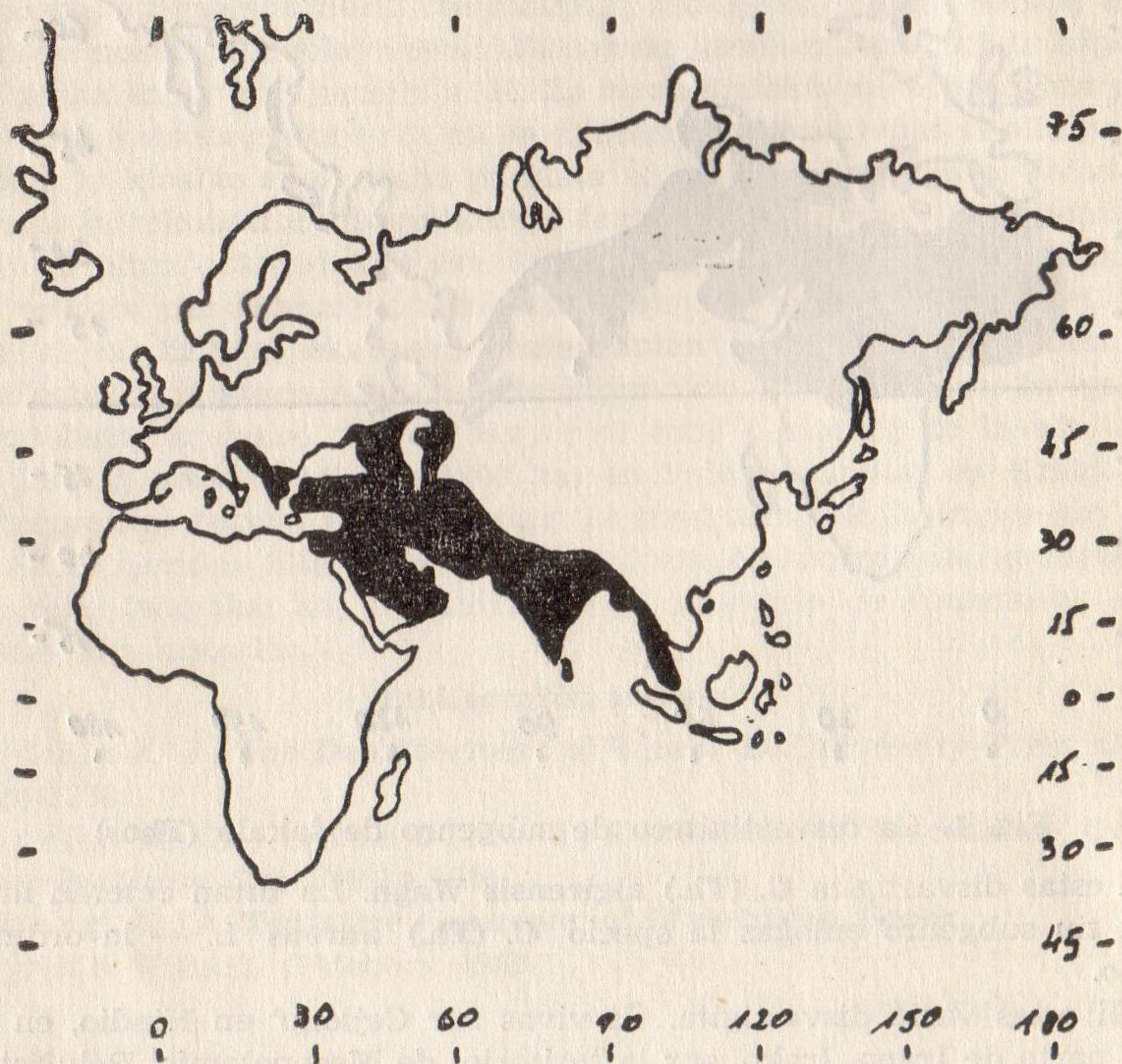
Fig. 2. La disvastigiteco de simpla ŝakalo Canis (Thos) aureus L.

vosto, kaj la altecon de 45—50 cm. La muzelo ne estas tiel pinta kiel ĉe vulpo, sed ĝi tamen estas pli pinta ol ĉe lupo. La oreloj estas mal-longaj, atingante \frac{1}{4} longecon de la kranio kaj inter si malproksimigitaj. Ĝi havas malpure-grize-brunan hararon, kiu surdorse kaj flanke estas iomete pli malhela aŭ la malhela koloro etendiĝas tra ŝultroj en neregulaj linioj.