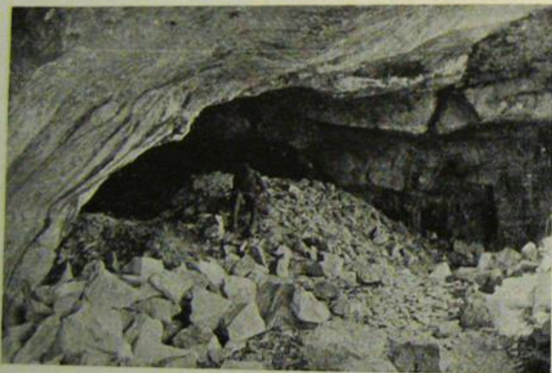
Fig. 2. Klasikepoka ŝtonrompejo sur la insuleto Sutvara.

Laŭ la ĝisnunaj esploroj, ŝajnas ke dum la klasika tempo sur la insularo de Korĉula la ŝtono estis hakata ekskluzive per la mineja metodo de la subtera elfosado, ĉe kiu oni ne forprenas la ŝtonaĉon t.e. la plej supran, malbonkvalitan ŝtontavolon, sed oni lasas ĝin netuŝita, kiel montras klare nia bildo (fig. 2). Verŝajne oni tion praktikis tial, ĉar sur tiuj ĉi insuloj la korodita ŝtontavolo dikas 1—4 metroj, kaj la forigado de tiom dika ŝtonmaso sen la uzo de eksplodado postulis multan penon kaj prenis multan tempon. Pro tio oni ko-