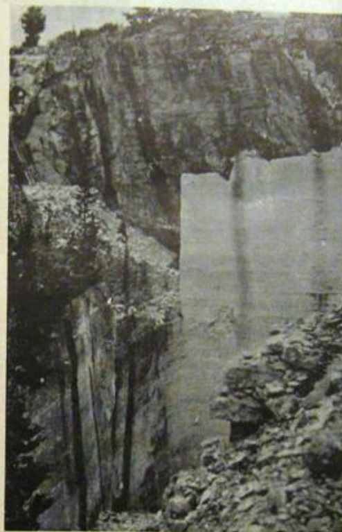
Fig. 3. Restaĵoj de mez- kaj novepokaj ŝtonminejoj sur la insuleto Vrnik.

sendube oni tute forlasis ĉi tie la subteran teknikon kaj ekuzis la surteran (eksteran). Laŭ tiu, la vertikale fortranĉita kaj patinita rokaro (fig. 3), kiu sur la insuleto Vrnik superas la altecon de 40 m, mialopinie ne estas restaĵo de klasikepokaj sed de mez- kaj novepokaj ŝtonminejoj.