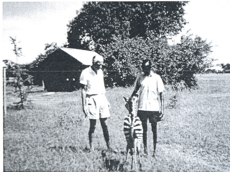
Bildo 1: Bernhard Grzimek serĉas en la veterinara explorejo Kirawira (vd. la mapon en paĝo 219) taŭgan foto-objekton por sia gazeto “ La Besto “ (“ Das Tier “)

Zoologo kaj veterinaro, zoodirektoro kaj naturprotektanto, libro-aŭtoro kaj bestofilmisto, televidstelo kaj mon-donac-kolektanto: la 24-an de aprilo 2009 profesoro d-ro Bernhard Grzimek (Gjimeko) fariĝus cent jarojn. Kiel preskaŭ neniu alia li akcentis, ekde la 1950-aj jaroj, la temon “ Bestoj kaj Naturo “ – ne nur en Germanujo. Ankaŭ se lia nomo pleje estas konata pro la libro kaj filmo “ Serengetio nepre ne mortu “ kaj siaj 30-jardaŭraj televid-elsendaĵoj “ Spaco por bestoj “, li estis multe pli ol “ la televida bestoprofesoro “. Gjimeko esence pre-